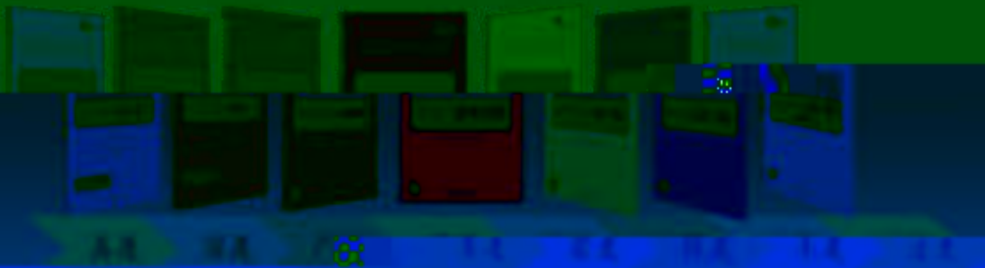
一体化课程教学设计 综合实训基地