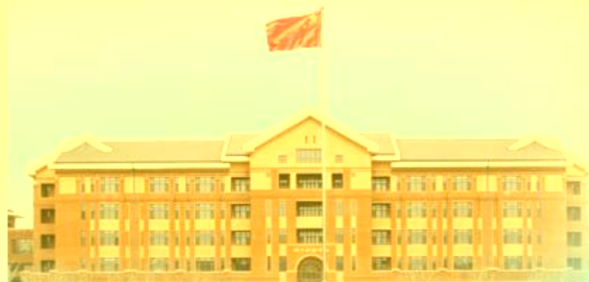
天津机电职业技术学院 TIANJIN MECHANICAL COLLEGE OF ELECTRICITY AND ELECTRONICS